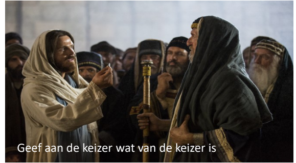
Geef aan de keizer wat van de keizer is