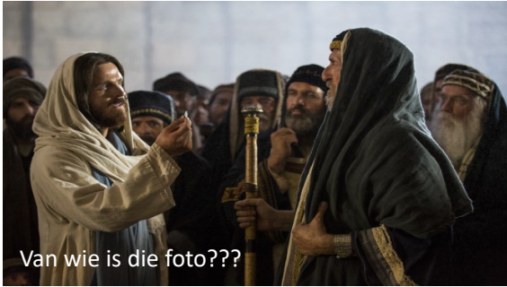
Van wie is die foto???