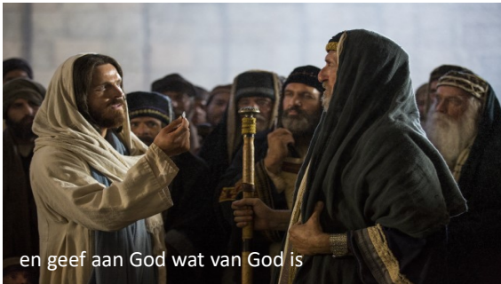
en geef aan God wat van God is